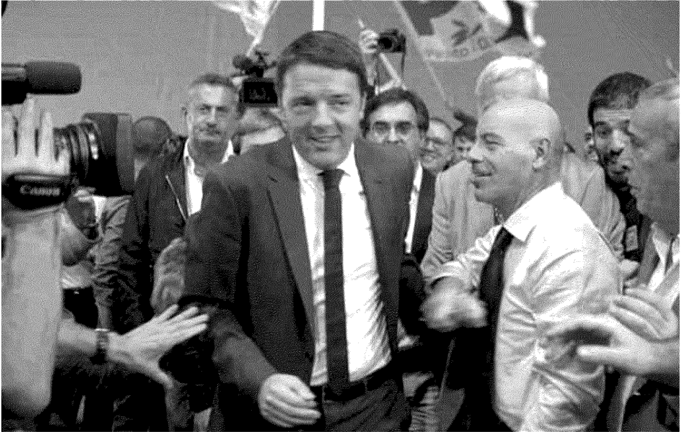
La convention Il sindaco di Firenze ieri a Bari per lanciare la sua candidatura alla guida del Pd: primo appuntamento dei circa cinquanta giorni di campagna elettorale